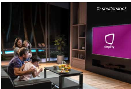
Die ORS wartet und serviert das bundesweite Sendernetz bei jeder Witterung rund um die Uhr sieben Tage die Woche.