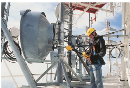
Die ORS betreibt mit rund 430 Sendeanlagen ein flächendeckendes Sendernetz für die digitale TV-Übertragung über Antenne.