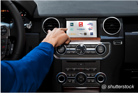
Immer mehr Neuwagen sind mit DAB+ Empfang ausgestattet.