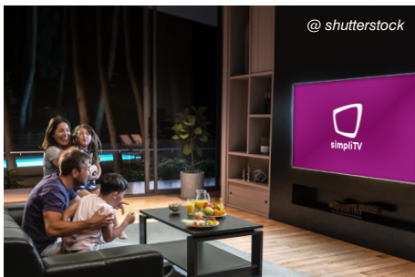
Die ORS wartet und serviert das bundesweite Sendernetz bei jeder Witterung rund um die Uhr sieben Tage die Woche.