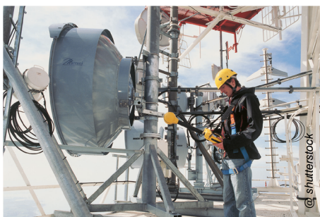
Die ORS betreibt mit rund 430 Sendeanlagen ein flächendeckendes Sendernetz für die digitale TV-Übertragung über Antenne.