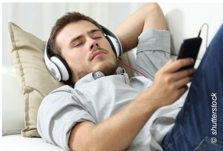
Radio-Streaming macht Inhalte über das Internet verfügbar.

Auch beim Radiokonsum steigt der Wunsch nach Unabhängigkeit von Zeit und Ort. Mit ihrem umfassenden Know-how rund um Streaming-Leistungen kann die ORS diese Nachfrage bestmöglich erfüllen und setzt Radio-Streaming-Lösungen umfassend und kompetent um.